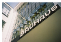
Imagem 1 - Bauhaus