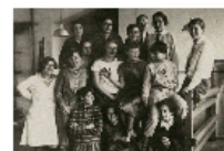
Imagem 3 - mulheres da Bauhaus

Livro Bauhaus (1919-1933) – Magdalena Droste – editora Taschen Livro História da Arte – Ernest Gombrich – editora LTC Site: www.modifica.com.br/mulheres-nas-artes-o-machismo-da-bauhaus-e-revolucaoetextilde-gunta-stoitz Livro Enciclopédia Barsa Universal volume:3 – editora Barsa Planeta https://www.designparavida.com/publicacoes-da-bauhaus-disponiveis-para-download-gratuito/ http://www.modifica.com.br/mulheres-nas-artes-o-machismo-de-bauhaus-e-revolucao-textil-de-gunta-stoitz/#:~:text=PrfGPIU